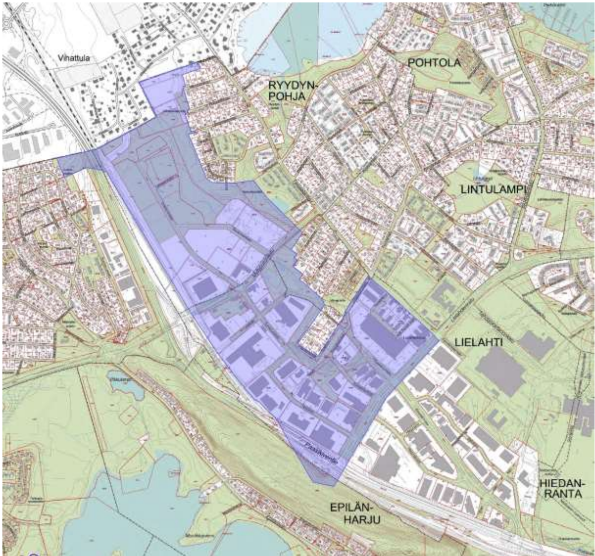
Kuva 1. Selvitysalueen rajaus kartalla esitettyä.

Selvitysalueena oli Lielahden yleissuunnitelma-alue nro 8832. Se sijoittuu Tampereen luoteisosiin, pääasiassa Teivaalantien, Lielahdenkadun, Paasikiventien ja Ylöjärven kuntarajan rajaamalle alueelle. Selvitysalue on kooltaan n. 90 hehtaaria (Kuva 1).